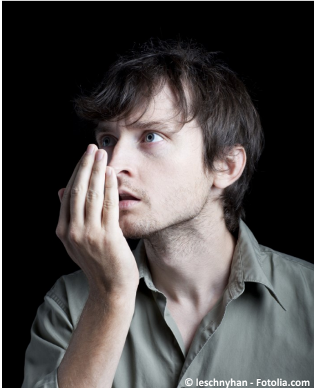
Mundgeruch kann unsicher, gehemmt und einsam machen ...

Fühlen Sie sich manchmal anderen gegenüber gehemmt?