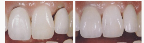
Metallkeramik-Kronen mit dunklen Rändern (links) und ästhetische Kronen aus reiner Keramik (rechts).

Wenn Sie wirklich schöne Zähne wollen, sollten Sie sich für Kronen und Brücken aus reiner Keramik entscheiden.