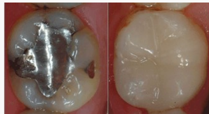
Bedenkliches Amalgam (links) oder verträgliche und ästhetische Füllungen aus Komposit oder Keramik (rechts)?

Als Kassenpatient haben Sie die Wahl zwischen Amalgam und kurzlebigen Kunststoff-Füllungen. Wenn Sie eine dauerhaftere und schönere Lösung wollen, sollten Sie sich für Kompositfüllungen oder für Keramikinlays entscheiden.