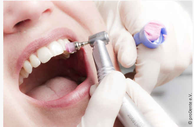
Die Professionelle Zahnreinigung wird von speziell ausgebildeten Prophylaxe-Fachkräften ausgeführt und ist eine lohnende Investition in die eigene Gesundheit.

Sie ersparen sich oft Kronen, Implantate und Zahnfleischoperationen.“