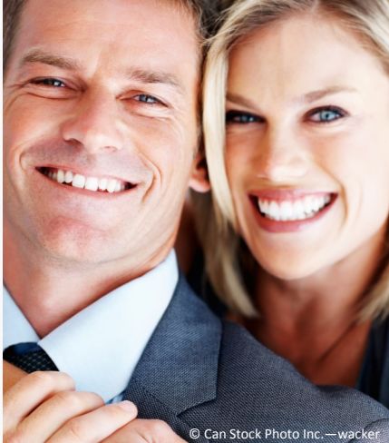
Selbstsicher mit gepflegten Zähnen

Dann werden Mund, Zähne und Zahnfleisch untersucht. Die Zahnbeläge werden angefärbt, um sie besser sichtbar zu machen und es wird die Tiefe der Zahnfleischtaschen gemessen.